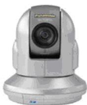
Cámara IP PTZ Panasonic HCM-381CE

Durante la noche, y como complemento al sistema de alarma tradicional, el sistema DocuRemote sigue operativo ante cualquier incidencia que se produzca, permitiendo un mas eficiente control de los espacios internos y periféricos de los Centros ABX.