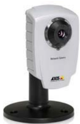
Cámaras de red AXIS 207/207W con soporte de cámara - soporte incluido