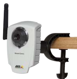
Cámaras de red AXIS 207/207W con pinza de montaje flexible - pinza incluida