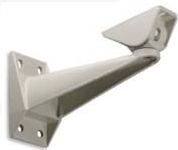
Soporte de pared con rótula (285 mm longitud)

La carcasa tiene una temperatura interna controlada lo que permite que la cámara pueda estar operativa bajo temperaturas de +50°C a - 20°C. Para su instalación en el techo, en una pared, en una esquina o en un poste, son necesarios los siguientes accesorios: