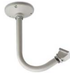
Soporte de techo con paso interno de cables