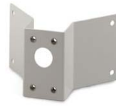
Adaptador de esquina para soportes de pared