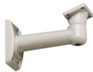
Soporte de pared con paso interno de cables y rótula